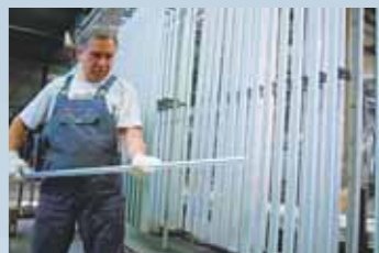
In unserem leistungsfähigen Eloxalwerk können auch Lohnaufträge wirtschaftlich ausgeführt werden.