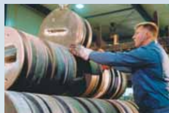
Eine sorgfältige Lagerung sichert die sofortige Einsatzbereitschaft der Werkzeuge.

Sie bedienen sich modernster Computertechnologien und Produktionsverfahren und sind mit ihrem besonderen Know-how und ihrer Erfahrung in der Lage, selbst komplizierte Aufgabenstellungen in kurzer Zeit souverän zu lösen und optimal umzusetzen.