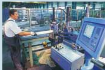
CNC-gesteuerte Planbiegemaschine mit elektronischem Steuerpult.