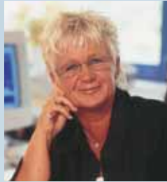
Unsere freundlichen Mitarbeiterinnen und Mitarbeiter sind jederzeit für Sie da.