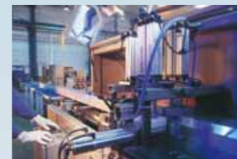
Die Sägen arbeiten mit vollautomatischem Zangenvorschub.

Zu unserer richtigen Hochform laufen wir bei der Veredelung der Strangpressprofile auf. So können in unserem angeschlossenen Eloxalwerk nicht nur Profile aus der eigenen Produktion veredelt werden, sondern es steht auch für anspruchsvolle Fremdaufträge zur Verfügung. Ein geschlossener Recyclingkreislauf mit eigener Wasseraufbereitungsanlage schafft die Voraussetzungen für eine Umweltschonende Produktion.