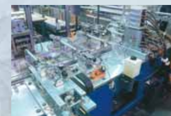
Dieser CNC-Bearbeitungsautomat führt bis zu fünf Arbeitsgänge durch.