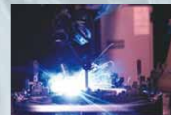
Mehrere Schweißautomaten garantieren eine konstant gleichbleibend hohe Fertigungsqualität.