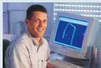
Die Werkzeugentwicklung ist selbstverständlich CAD-gestützt.

Am Anfang unserer Produktion stehen zwei Strangpressanlagen mit 1.250 und 2.350 t Presskraft. Darauf pressen wir kundenspezifische Aluminium-Präzisionsprofile in unterschiedlichsten Dimensionen, Ausführungen und Schwierigkeitsgraden.