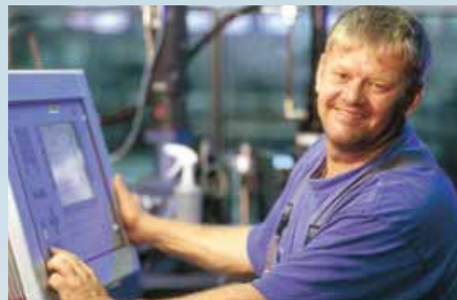
Unser Unternehmen lebt von dem Know-how und der Erfahrung jedes einzelnen Mitarbeiters.

NordAlu ist ein dynamisches, mittelständiges Unternehmen, das innovative und umfassende Problemlösungen aus Aluminium anbietet. Unser Produktionsspektrum reicht vom Strangpressen unterschiedlichster Aluminiumprofile über das Oberflächen veredelnde Eloxieren bis zur präzisen mechanischen Bearbeitung.