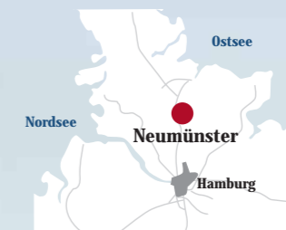
NordAlu liegt strategisch günstig, nördlich von Hamburg, zwischen Nord- und Ostsee.

Die Entscheidung für NordAlu ist nicht nur eine sympathische Wahl, sondern stets auch eine Entscheidung für „Präzision in Aluminium“.