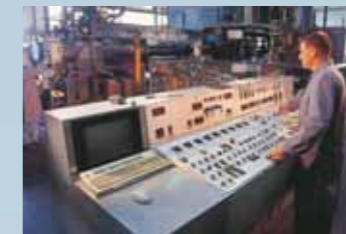
Das Steuerpult einer unserer Strangpressanlagen.

Auch bei der mechanischen Weiterbearbeitung kennen wir fast keine Grenzen. In kürzester Zeit können selbst ausgefallene Kundenwünsche zu jeder geforderten Marktreife ausgeführt werden – vom standardisierten Halbzeug bis zum komplett einbaufertigen Präzisionsteil.