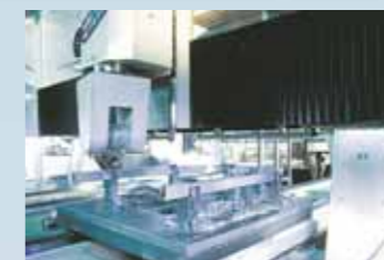
5-Achsen CNC-Doppelspindel-Fräszentrum mit kombinierbaren Bearbeitungstischen.

Auch bei der mechanischen Weiterbearbeitung kennen wir fast keine Grenzen. In kürzester Zeit können selbst ausgefallene Kundenwünsche zu jeder geforderten Marktreife ausgeführt werden – vom standardisierten Halbzeug bis zum komplett einbaufertigen Präzisionsteil.